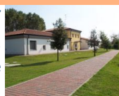
Oasi Torre Abate

"Oasi Torre Abate" di Santa Giustina di Mesola (FE) è l'ideale per chi ama soggiorni nel segno della natura e della cultura. Adatta a chiunque voglia passare momenti di tranquillità immersi nel verde del